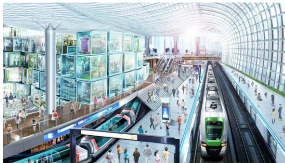
夢洲駅 開放的で出会いの予感に満ちた駅

2018年12月20日 Osaka Metro Group「地下空間の大規模改革及び夢洲開発への参画について」より