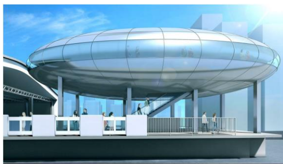
新大阪駅 コンセプトは「近未来の大阪」